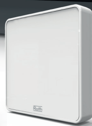
Roth Touchline® PL langaton lattia-anturi