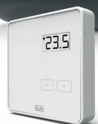
Roth Touchline® PL langaton termostaatti