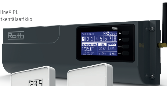
Roth Touchline® PL langaton kytkentälaatikko

Lattia-anturi tulee asentaa samaan lähtöön kuin huonetermostaatti silloin, kuin lattia-anturia käytetään maksimilämpötilan valvomiseen (esim. puulattia). Lattia-anturia voi myös käyttää mukavuuslämpötilan valvomiseen, esimerkiksi kylpyhuoneessa.