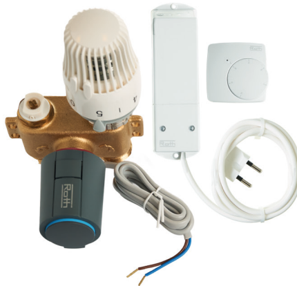
Roth RTL-venttiili (10-50 °C) langattomalla huonetermostaattilla LVI-nro 2070687