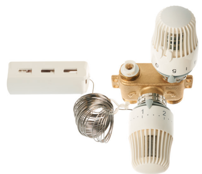
Roth RTL-venttiili kapillaarianturilla, 5 metriä LVI-nro 2070688