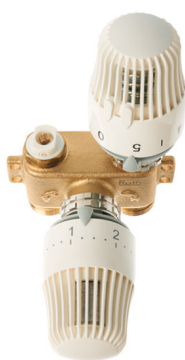
Roth RTL-venttiili (10-50 °C) huonetermostaattilla LVI-nro 2070686